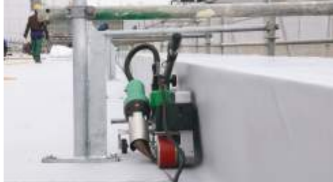
Автоматическая сварочная машина UNIROOF без проблем сваривает все труднодоступные места на кровле